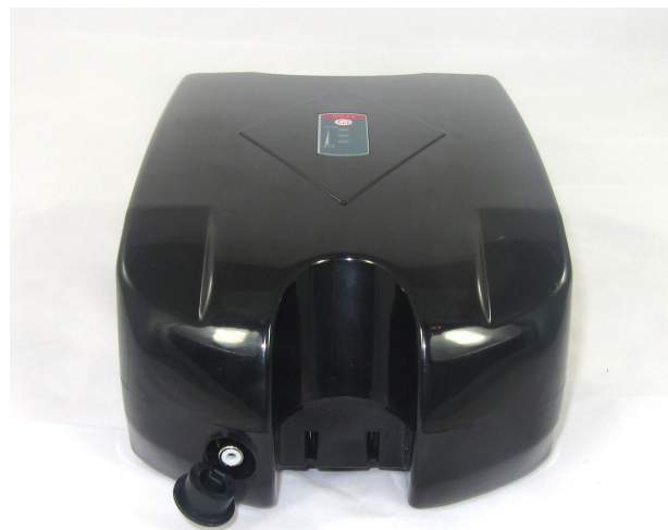
Prise RCA pour chargeur

Une fois la batterie chargée, le témoin repasse au vert. Vous pouvez laisser la batterie branchée sur le chargeur quelques heures, il n'y a aucune obligation à débrancher le chargeur immédiatement. Généralement, on branche le soir et on débranche le matin.